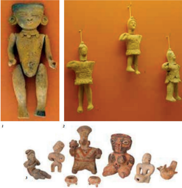
Resim 4: Antik Çağdan Günümüze Kalan Pişmiş Toprak Bebekler (Sevim. C, & Gönül. E, 2012).

dir. Antik Yunan ve Roma'da ise çocuklar, yetişkinliğe geçiş oyuncaklarını tanrılara sunmuş ve mezarlarda topraktan yapılmış oyuncaklar bulunmuştur. Bu oyuncaklar bazen ritüellerde kullanılan nesnelere olarak da değerlendirilmiştir. Oyuncakların seri üretimi 1700'lerde Almanya'da başlamış, Osmanlı döneminde ise top, topaç, toprak düdük ve hayvan bağırsağından yapılan balon gibi oyuncaklar olduğu görülmüştür. Türkiye'de oyuncak yapımı, Selçuklu ve Osmanlı döneminde Orta Asya'dan gelen bir sanattır ve Anadolu'da oyuncakların varlığı eskiye dayanır. Günümüzde oyuncak üretimi büyük şirketler tarafından yapılmakta, ulusal ve uluslararası oyuncak fuarları düzenlenmektedir. Oyuncak seçimi, dikkatli yapılması gereken önemli bir süreçtir. Oyuncaklar, problem çözme, merak, hayal gücü, girişimcilik, öz güven vb. becerilerin geliştirilmesi açısından önem arz etmektedir. Seçim yaparken çocuğun büyüme çağına uygun, eğitici, dinamik olmasına özen gösterilmelidir. Eğitici oyuncaklar, çocukların kavramları öğrenmelerine, terapilere ve diğer gelişim programlarını desteklemelerine yardımcı olur (Kırman. A,2019;24-27).