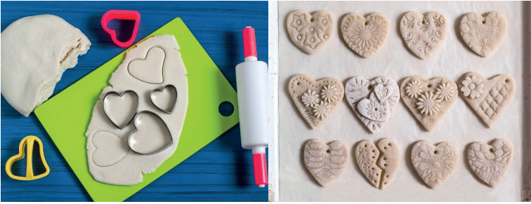
Resim 5: Tuz Seramiği Çalışmasına örnek.