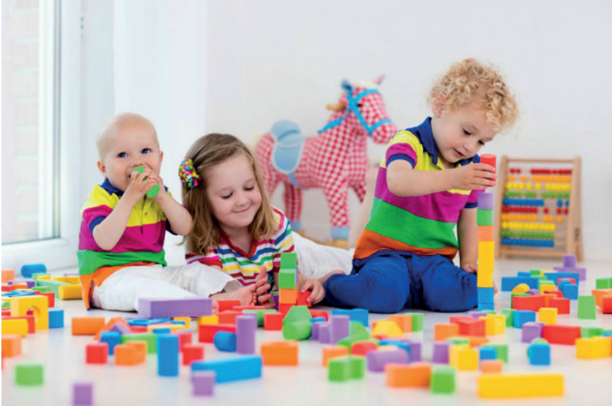
Resim 1:Çocuk ve Oyun ( www.turgutlutivi.com E.T: 07.05.2024 )

ÇOCUK , 18 yaşına gelmemiş birey olarak tanımlanır ve gelişim süreci Bebeklik, İlk Çocukluk, İkinci Çocukluk ve Ergenlik olmak üzere 4 döneme ayrılır. Bu dönemlerin her biri, çocuğun fiziksel, zihinsel ve duygusal gelişiminde önemli bir rol oynar ( www.cadempsikoloji.com.tr , 23.04.2022).