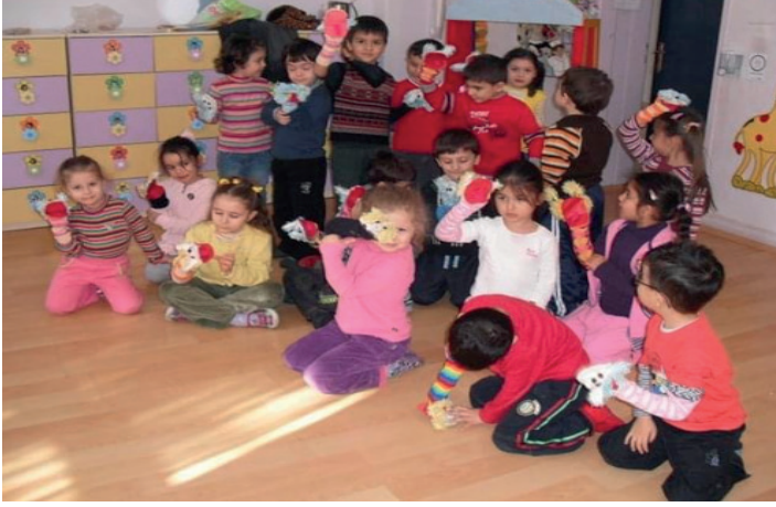
Resim 4: Okul Öncesi Eğitimde Kukla Gösterimi Eğitimi (Coşkun.S.N.2021Arşivi).

Sanat etkinlikleri, ilkokul ve ortaokulda çeşitli alanlarda yapılmaktadır. Bunlar arasında müze gezileri, müzik etkinlikleri, resim, tiyatro, iki ve üç boyutlu kâğıt çalışmaları ile öğrencilerin eserleri eleştirel bir bakışla incelemeleri gibi aktiviteler yer alır.