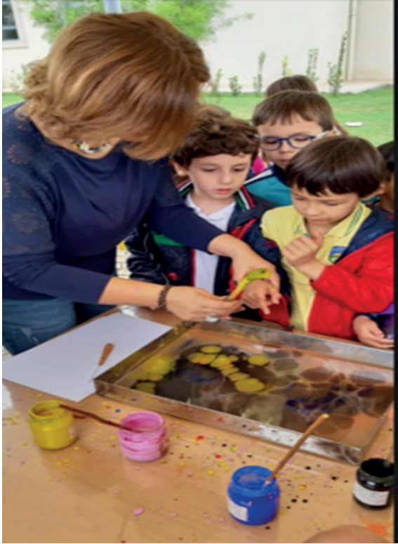
Resim 3: Ebru Çalışması Eğitimi (Coşkun.S.N.2021Arşivi& Dilek A vd.2018b).

da vurgulanmaktadır. 20. yüzyıldan itibaren toplumsal değişim, teknoloji ve bilimdeki ilerlemelerle birlikte yaratıcılık kavramı daha fazla değer kazanmış ve sanat eğitimi, genel eğitimde önemli bir yer edinmiştir. Sanat, insanın hem zihinsel hem de duyuşsal yönlerine hitap eder. Sanat, özgün yapısını koruyarak eğitim sürecinde insana önem verir, ancak sınırlarını belirlemek zordur. Sanat, sınır çizmek ve katı kurallar koymakla uyumsuzdur, bu yüzden sanatın doğasını tamamen değiştirmek mümkün değildir. Eğitim ise sanatsal bir etkinlikten farklı olarak belirli bir süreç izler ve bilimsel bir yaklaşım gerektirir. Sanat, bilim ve eğitim, insanların yaşamlarını sürdürebilmesi ve iletişim kurabilmesi için ortak bir rol oynar. Bu süreçlerin her biri farklı olsa da, insanlar bu üç alanla birlikte yaşar ve etkileşimde bulunurlar (Tütüncü, S,2006;10-11).