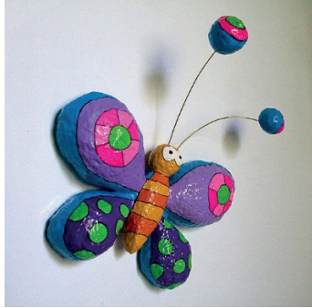
Resim 7: Kağıt Hamurundan Oyuncak Örneği.

Kâğıt hamuru, kâğıt yapımında kullanılan, lif bitkilerinden veya atık kâğıttan elde edilen bir malzemedir. Hazırlanması zaman alabilir, bu yüzden önceden hazırlanması faydalıdır. Çocuklar da bu sürece dâhil edilebilir. Kâğıtların tamamen erimesi ve hamurun düzgün dağılması önemlidir. Kâğıt hamuru, dünyada en bol bulunan hammaddelerden biridir.