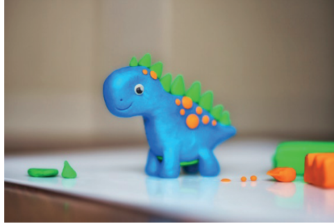
Resim 6: Kil Hamuru Örneği ( www.cumhuriyet67ortaokulu.meb.k12.tr/ E.T:22.11.2024).

Kil hamuru, okul öncesi dönemde çocukların motor becerilerini ve el kaslarını geliştirmelerine yardımcı olan yumuşak ve esnek bir materyaldir. Su, un ve tuz gibi basit malzemelerle hazırlanır. Çocuklar, kil hamuruyla şekil vererek, yoğurarak ve sıkarak ince motor becerilerini geliştirebilirler. Ayrıca, farklı dokuları ve renkleri keşfederek duyuşal deneyimlerini zenginleştirebilirler. Kil hamuru, matematik, fen ve dil gibi öğrenme alanlarını desteklemek için de kullanılabilir. Çocuklar, renkleri öğrenebilir ve şekiller yaparak geometri kavramlarını keşfedebilirler. Ayrıca, hamurla oynamak duyuşal gelişimi destekleyip, streslerini azaltmalarına yardımcı olabilir ve grup halinde oynayarak sosyal becerilerini geliştirebilirler.