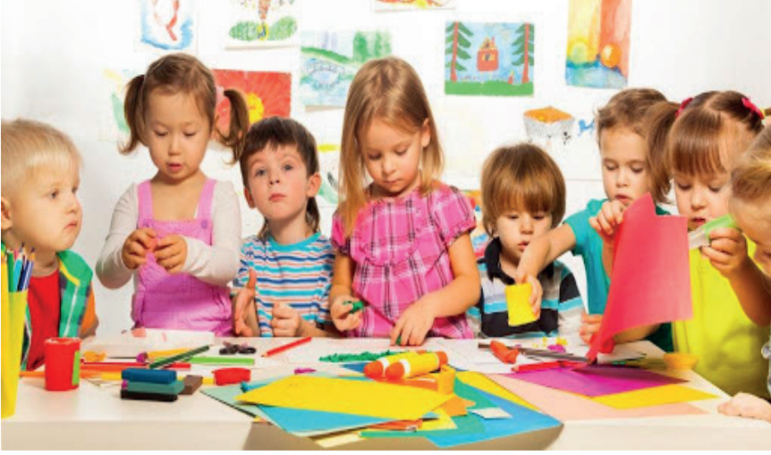
Resim 5: Yaratıcılık Etkinlikleri (www. etwinningonline.eba.gov.tr.E.T:16.06.2024).

Yaratıcılık, günümüzde sıkça konuşulan ancak genellikle sanatla ilgili olmayan alanlarda kullanılan bir kavramdır. Çocuklar, farklı etkinlikler aracılığıyla sorun çözmeyi ve yeni şeyler keşfetmeyi öğrenir. Yaratıcılık, doğuştan gelen bir özellik olup doğru koşullar sağlandığında gelişebilir. Bu süreç, esnek düşünmeyi, sezgiyi, merakı ve metaforları içerir.