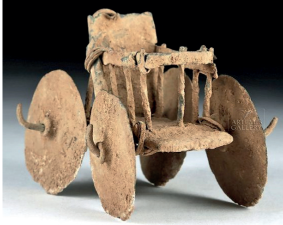
Resim 2: Anadolu, Erken Tunç Çağı, Bronz Bir Oyuncak Araba (www.leblebitozu.com ; 29.03.2024).