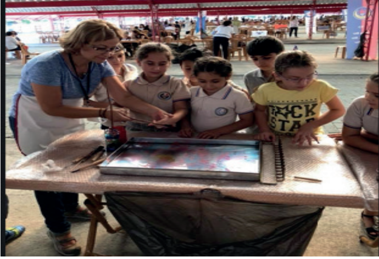
Resim 2: Ebru Çalışması Eğitimi (Coşkun.S.N.2021Arşivi).

Genel olarak sanat, insanın doğayı kendi duygu ve düşünceleriyle çiz-giler, renkler, kelimeler, ritimler gibi araçları kullanarak, öznel bir üslupla etkili bir şekilde resmetme girişimidir. Sanatın tanımına ilişkin tartışmalar antik çağa kadar uzanmaktadır. Sanat; iletişim amaçlı, eğitim amaçlı, kültürel ve aydınlatıcı amaçlı, nitelik taşımaktadır(Türkmen. B,2021;30-31).