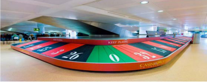
Resim 6. İtalya Havalimanı Gerilla Pazarlama Örneęi (Karakan, 2021)

Son olarak Resim 6 da İtalya havalimanında bulunan konveyör bandı, kumarhanelerde bulunan rulet masasına benzetilerek Venedik řhrinde bulunan Casino di Venezia isimli kumarhane gerilla pazarlama örneęi yer almaktadır.