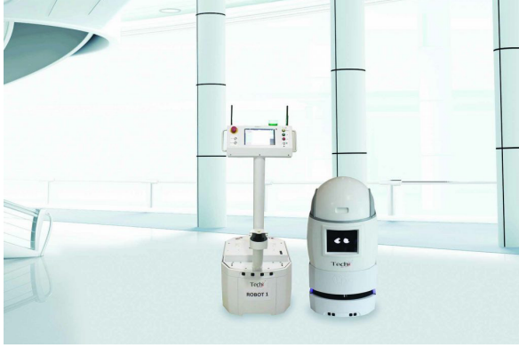
Şekil 3. Kat Hizmetleri Robotu Robbie (Parkavenue,2022)

pabilme yeteneği vermektedir. Bu bağlamda otel maliyet ve iş gücü konusunda oldukça avantajlı fırsatlar sunmaktadır (Karagöz ve Sezgin, 2021).