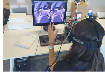
Şekil 5. Sanal Gerçeklik Seti

AG de, içinde bulunduğumuz ortamı geliştiren veya destekleyen görseller bilgisayar sayesinde sağlanır ve kullanan kişinin gerçekliğine dâhil edilir. SG ise başa takılan gözlük şeklinde bir ekran ve DataGlov isimli eldivenden oluşur. Kullanıcılar bu ekipmanlar sayesinde sanal gerçeklik teknolojisinden faydalanmaktadır.