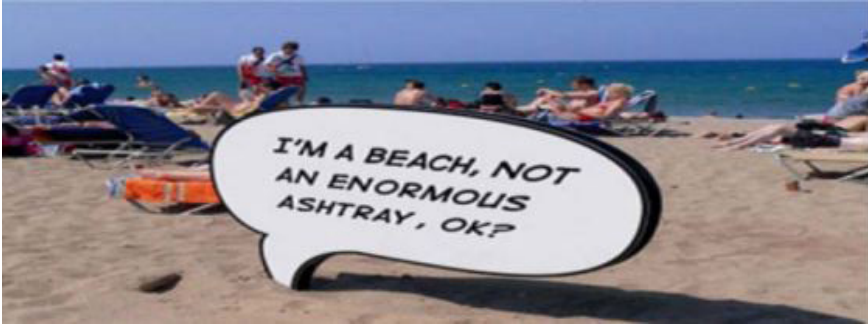
Resim 3. Gerilla Pazarlama Örneği 'Barselona Plajı', (Karakan, 2021).

Destinasyonlarda bulunan toplu taşıma araçları da turizm endüstrisi içerisinde gerilla pazarlama uygulamalarında yaygın olarak kullanılmaktadır. Resim 4'te Seul metrosunda uygulanan gerilla pazarlama örneği deniz-kum-güneş turizm teması ile plaj öğesi kullanımı gözlemlenmektedir. Resim 5'te ise Kopenhag şehrindeki hayvanat bahçesine ziyaretçileri çekebilmek amacıyla yapılan gerilla pazarlama örneği yer almaktadır.