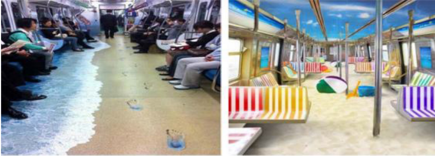
Resim 4. Metroda Gerilla Pazarlama Örneği, Seul (Murat, 2017)

Destinasyonlarda bulunan toplu taşıma araçları da turizm endüstrisi içerisinde gerilla pazarlama uygulamalarında yaygın olarak kullanılmaktadır. Resim 4'te Seul metrosunda uygulanan gerilla pazarlama örneği deniz-kum-güneş turizm teması ile plaj öğesi kullanımı gözlemlenmektedir. Resim 5'te ise Kopenhag şehrindeki hayvanat bahçesine ziyaretçileri çekebilmek amacıyla yapılan gerilla pazarlama örneği yer almaktadır.