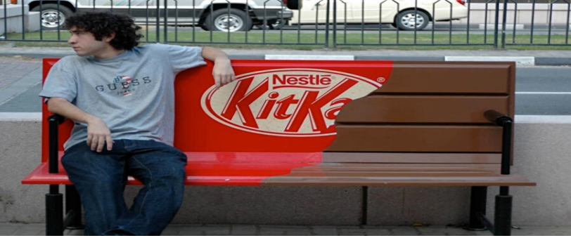
Resim 2. Kitkat Ortam Pazarlama Örneđi (Tosun, 2021)

Ortam pazarlaması geleneksel olarak yapılan tanıtım araçlarından farklı kılan ana unsurlarından birisi, genellikle kamusal alanların ve gerçekleşeceği beklenen işlevle bağlantılı objelerin kullanılmasıdır. Örneğin, duraklarda bulunan banların mobilya üretici firmalar tarafından ilgi çekici bir tasarımla düzenlenmesi ya da halka açık park, bahçe ve alanlarda bulunan bankların farklı şekil ve tarzlarda giydirilmesi (Resim 2). Ortam pazarlamasının bir özelliđi de müşteriler ile direkt etkileşime girebilmektir. Ortam pazarlaması, benzersiz yaratıcı fikirlere odaklanır, yeni araç ve iletişim kanallarından yararlanmaktadır (Flieger, 2017).