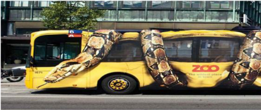
Resim 5. Hayvanat Bahçesi Tanıtımı, Kopenhag (Murat, 2017)