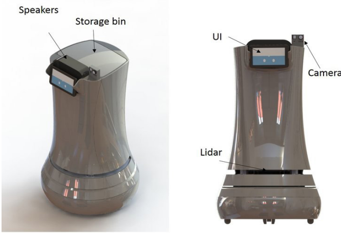
Őekil 2. Servis Robotu Relay (Researchgate, 2021)

Verilen rneklerdeki gibi robotlar otel iinde birok grevi yerine getirebilmektedirler. Robotlar otellerde farklı alanlarda misafirler iin doęrudan hizmet vermekle beraber alıřana yardımcı olarak grevlendirilebilmektedirler. n broda hizmet veren robotlar, bagaj tařıyan ve depolayan robotlar, sesli komutla alıřan oda asistanları son zamanlarda otellerde hizmet veren robotlardır (Demir, 2021). eřitli tesisler konukların odalarına gıda servisi yapılması gibi hizmetler iin robotları kullanmaktadır (Karagz ve Sezgin, 2021). Savioko Őirketinin retimini yatıęı garson robot Relay, otellerde misafirlerin verdikleri sipariřleri odalarına gtrmekle grevlidir. Garson robotlar, verilen sipariřleri tařımak iin sipariřlerin bulunduęu kapalı bir hazneye sahiptir.