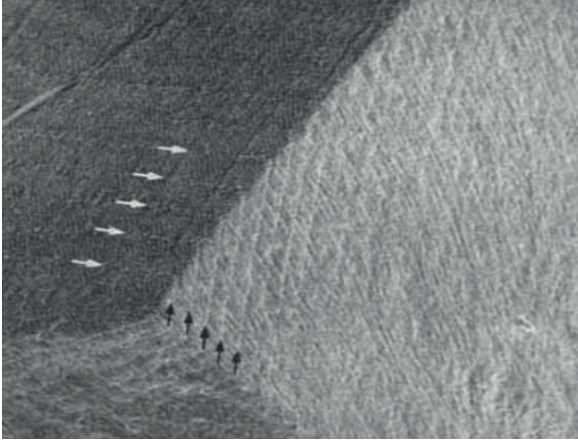
Resim 1. Bir maksiller birinci küçük azı dişinin minesindeki düzenli aralıklı Retzius çizgileri (Risnes, 1990).